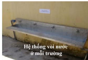
Hệ thống vòi nước ở môi trường