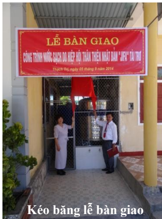
Kéo băng lễ bàn giao