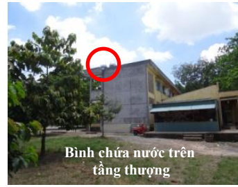
Bình chứa nước trên tầng thượng

Số học sinh 2500 em vào tháng 4 năm ngoái của trường giờ đã lên đến 2992 em. Phí vận chuyển nước mỗi tháng tốn 2 triệu đồng nên phụ huynh học sinh đã vui vẻ tự nguyện đóng góp 40 triệu đồng để lắp đặt bình chứa nước trên tầng thượng và hệ thống vòi nước ở mỗi trường.