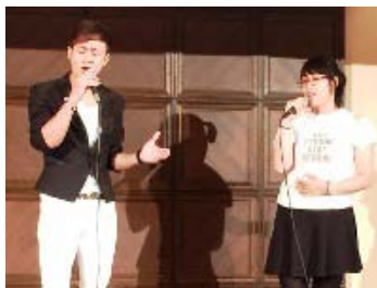
ベトナム・デュエットソング♪