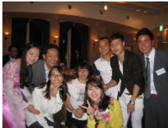
協力いただいたVYSA（在日ベトナム学生青年協会）の皆様