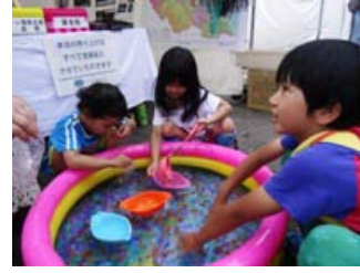
子どもたちで賑わうブース ぷよぷよすくいが人気