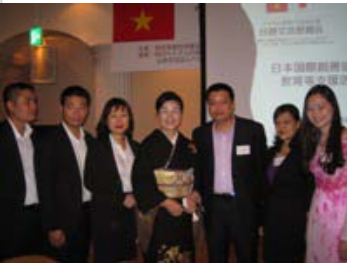
DOLAB訪日視察団の皆様

ベトナム教育支援募金やネパール復興支援募金にも御協力いただきましたこと、心からお礼申し上げます。