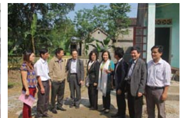
山岳地帯の子どもたちと交流 浄水装置設置の打合せ