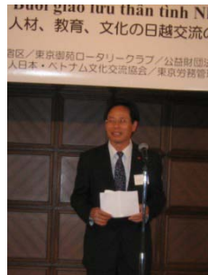
<最新のベトナム事情のお話> リエム参事官 フー等書記官