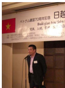
ナムDOLAB副局長ご挨拶