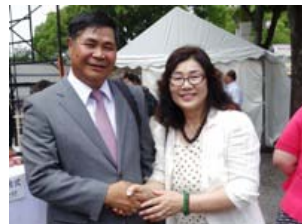
フン大使と固い握手