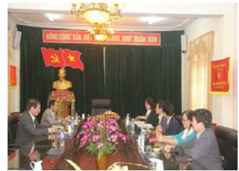
ハティン省教育訓練局長と学資支援に関する合意