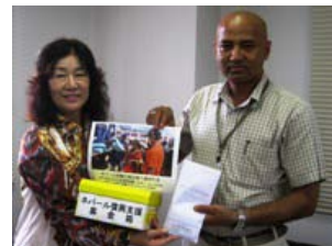
ネパール復興義援金贈呈 商工会議所カビルさんへ