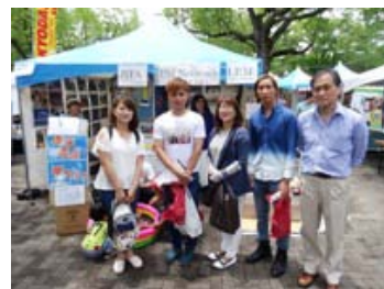
技能実習生の皆さんが会社の方と参加