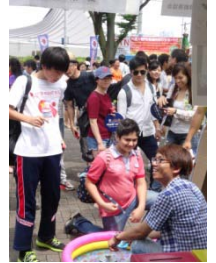
国際色あふれる会場