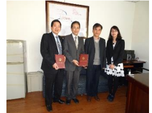
Chuyến thăm tháng 2/2016