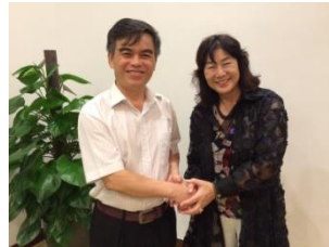
Chuyến thăm tháng 9/2015