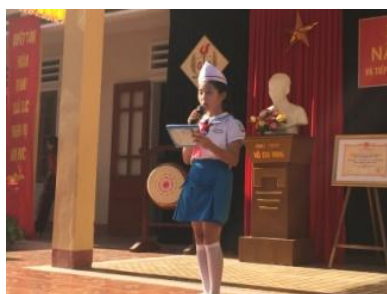
Đại diện học sinh phát biểu, gửi lời cảm ơn tới JIFA

Chi phí lắp đặt hệ thống lọc nước số 10 là 202 triệu 780 nghìn đồng (tương đương với khoảng 110 vạn Yên). Chúng tôi rất mong đợi tiếp tục nhận được nhiều hơn nữa sự ủng hộ của các nhà tài trợ Việt Nam và Nhật Bản.