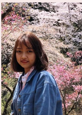
満開の桜を楽しみました

4月から新たな在留資格「特定技能」が創設され、アジア各国の青年を日本へ迎える選択肢が一つ増えました。両国の懸け橋となる外国人材を温かく迎え入れ、お互いの国の発展につなげられるよう、JIFAも地道に活動を進めていきたいと思えます。皆様の一層のご支援をお願いいたします。