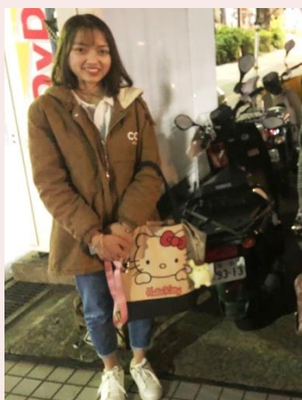
販売店の愛用バイクと

夕刊の配達のない4月の日曜日には、JIFAやIPMの皆さんと一緒に高尾のさくら保存林で、満開の桜を楽しみました。