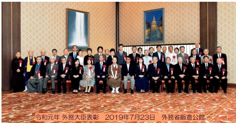
令和元年 外務大臣表彰 2019年7月23日 外務省飯倉公館