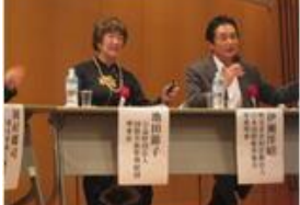
Ông Hoàng trưởng PLĐ ĐSQ VN, GD Okamoto và Chủ tịch Ikeda