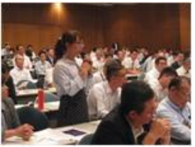
Phát biểu của thực tập sinh kỹ năng