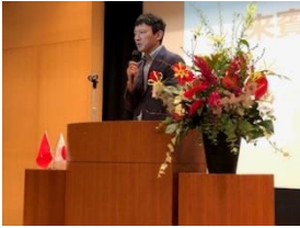
Phó tỉnh trưởng Kumamoto Ono