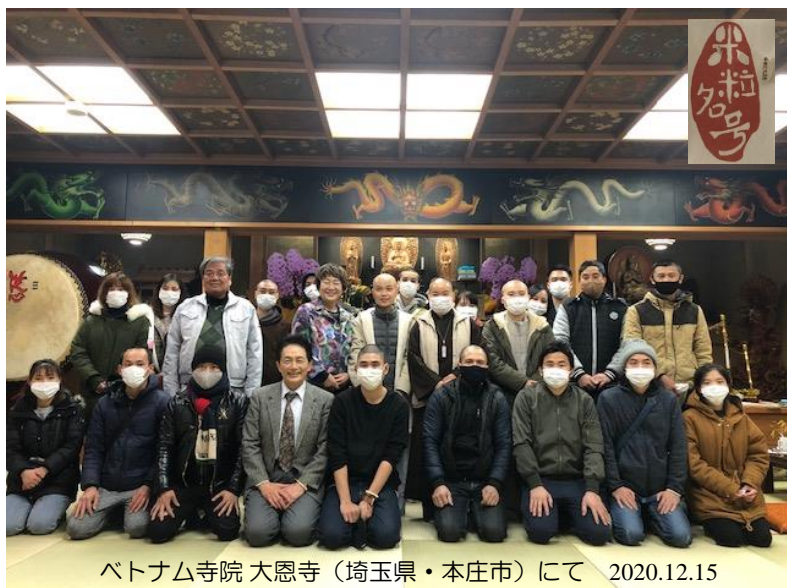
ベトナム寺院 大恩寺（埼玉県・本庄市）にて 2020.12.15

JIFAではGDF（グローバル・ドリーム財団）と連携して、IgM抗体とIgG抗体を迅速に検査できる新型コロナウイルス抗体検査キットの普及に努めています。