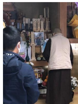
亡くなられた方々のご位牌