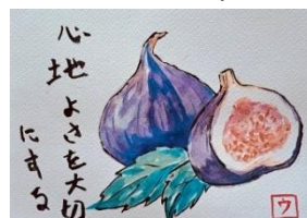
huy chương vàng