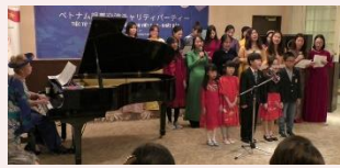
大使館員や子供たちの唄