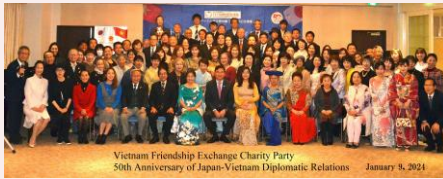
Vietnam Friendship Exchange Charity Party 50th Anniversary of Japan-Vietnam Diplomatic Relations January 9, 2024