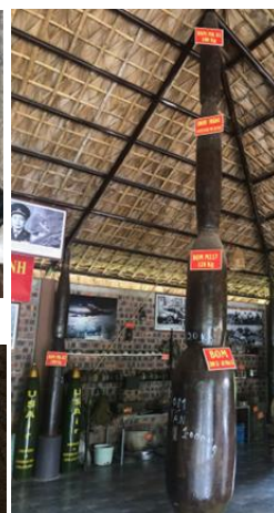
Bomb展示館 (各種爆弾を展示)