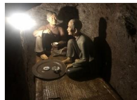
地下での生活を展示