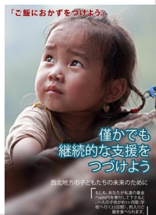
「ご飯をおかずをつけよう」

Trước đó, JIFA đã tham gia các hoạt động giao lưu, Đại hội VYSA hay các buổi gặp mặt thân thiết do VYSA tổ chức. Từ nay về sau, JIFA kỳ vọng sẽ phát triển hơn nữa hoạt động thân thiện quốc tế với Việt Nam tại Nhật Bản.