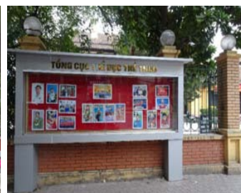
左からヴィン国際協力部長、ハインさん、伊瀬理事、スポーツ総局長、カンエリートスポーツ部副部長、ヴァン国際協力部副部長。右：ベトナム選手の活躍の写真掲示版