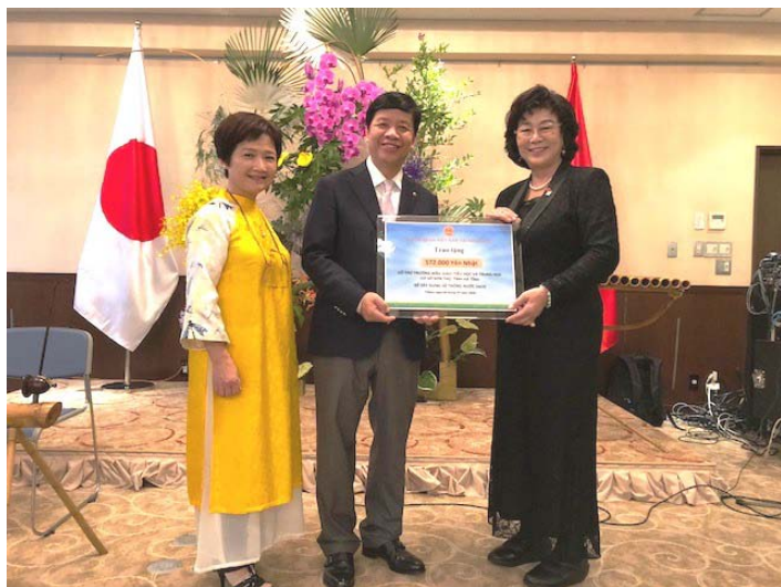
JIFAも協力したベトナム大使館チャリティ活動の収益から、ハティン省浄水装置の設置へ572,000円寄付をいただきました 2018年7月6日