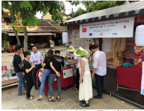
日本の打掛けなどの着物の展示が好評