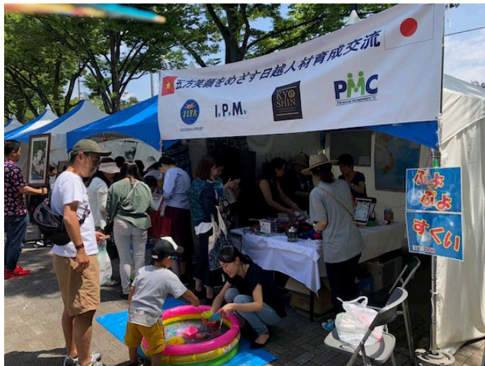
ベトナムフェスティバル2018 出展 (20180519-20)

JIFAでは、会員の皆様はじめ活動に賛同していただきました多くの方々のご協力のもと、中国、ベトナム、インドネシア、ミャンマー、タイ、ネパールなどのアジア各国との親善交流を進めてまいりました。 なかでも年間12万人以上の技能実習生や6万人以上の留学生が来日しているベトナムでは、困難な子どもたちや学校への支援を通じた親善交流活動をハティン省などで進めてまいりました。浄水装置の水を飲んで育った約18,000人の皆さんや学資支援を受けて育った延140名の子どもたちをはじめ、多くの青年の皆さんが日本とベトナムの懸け橋となって活躍していただけるよう、日越外交関係樹立45周年を迎える今年、ハティン省やクアンナム省と連携協定を結ぶことになりました。困難な子どもたちが経済的負担少なく日本へ来られるよう「適正な技能実習・留学実現プロジェクト」を推進し、基金を設けて支援していきたいと考えています。皆様方の一層のご支援をお願いいたします。