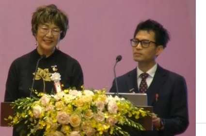
Lời chào từ Chủ tịch JIFA Ikeda Setsuko