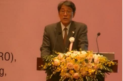
Lời chào từ đại sứ đặc mệnh toàn quyền Umeda Kunio